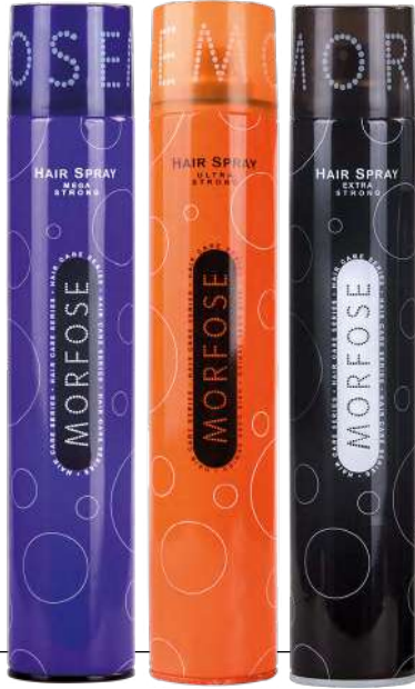
MORFOSE HAIR SPRAY

TR- SAÇ SPREYİ, güçlü formülü sayesinde her mevsimde ve her hava şartlarında saç şeklinizi korur. İçeriği sayesinde saçınıza parlaklık ve canlılık verir. EN- HAIR SPRAY, Protects your hair style under any season and air conditions thanks to its enhanced strong formula. Gives shine and vigor to your hair thanks to its contents. DE- HAAR SPRAY schützt Ihren Haarstyl durch seine gut entwickelte Rezeptur in jeder Jahreszeit und bei jedem Wette und gibt durch enthaltenes Glanz und vitalität. ES- Este spray para el cabello tiene una formulación fuerte que protege su peinado en todas las estaciones y en todas las condiciones climáticas. Su contenido hace que tu cabello esté fresco y brillante. RU- Спрей для волос защищает Вашу прическу в любое время года и при любых погодных условиях благодаря своей усиленной формуле. Благодаря своему особому составу придает блеск и жизненную силу Вашим волосам.